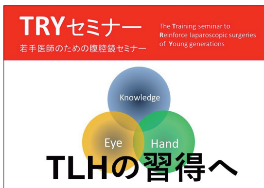
図7 | TRYセミナーのパンフレット： 3つの能力の習得