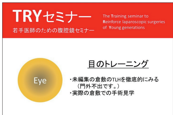
図5 | TRYセミナーのパンフレット：目のトレーニングの説明