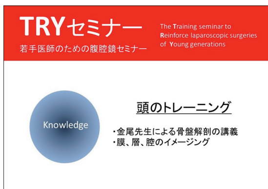
図6 | TRYセミナーのパンフレット： 頭のトレーニングの説明