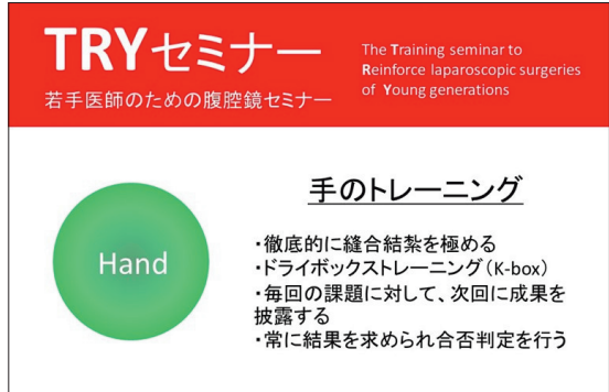
図4 | TRYセミナーのパンフレット：手のトレーニングの説明

まずは手のトレーニングである。ドライボックスによるトレーニングである。最もオーソドックスなトレーニングであり、世のセミナーは最もここに集約されているといっても過言ではない。しかしこのセミナーが普通のセミナーと違うのは、毎回課題を課され、それに対して結果を求められることである (図4)。一般のセミナーは概して「やりっぱなし」である。しかし、このセミナーは練習の結果が評価され、合否判定があるのである。カリスマの合否判定が日々のトレーニングと強制性を生まないはずがなからう。