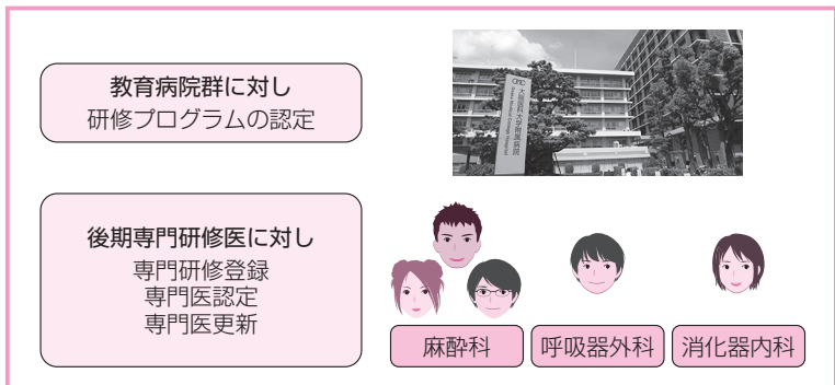
図1 ●日本専門医機構の役割