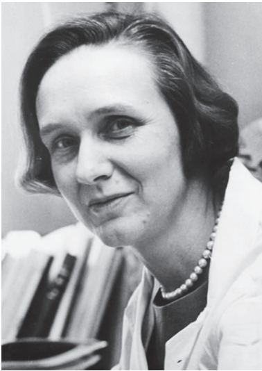
Fig. 7 Sarah A. Luse (1918~1970)

米国の神経病理学者。脳腫瘍の電子顕微鏡的研究の先駆者であり、かつ第一人者である。