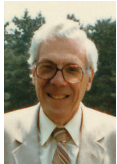
Fig. 9 Lucin J. Rubinstein (1924~1990)

ベルギー生まれの米国神経病理学者。Russellと共著の教科書は脳腫瘍病理のバイブルである。