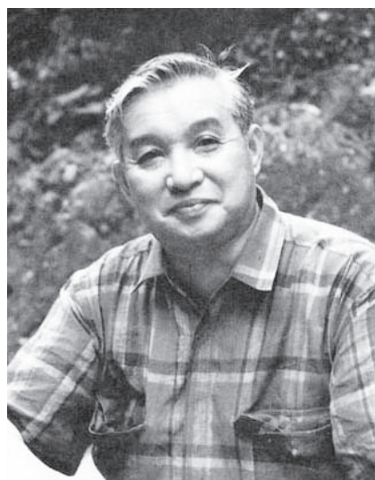
Fig. 11 石田陽一 (1925~1991) 日本の神経病理学者. 脳腫瘍 WHO 分類第 1 版編纂の日本代表委員. 第 2 版の改訂にも参加した.