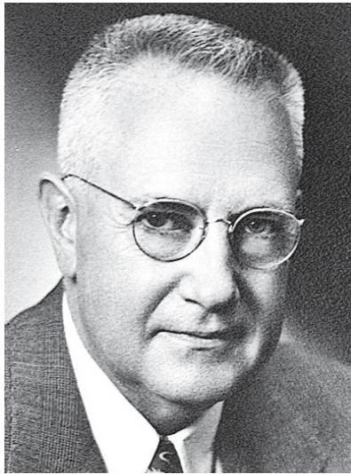
Fig. 3 Percival Bailey (1892~1973) 米国の神経病理学者, 脳外科医. Cushing とともに脳腫瘍の組織発生的分類を完成させた.