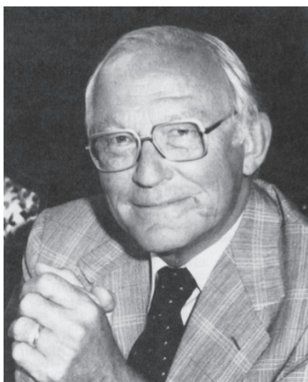
Fig. 10 Klaus J. Zülch (1910~1988) 西ドイツの神経病理学者. 脳腫瘍 WHO 分類創設の立役者. 記念の「Zülch 賞」は神経科学の基礎研究者に贈呈されている.

脳腫瘍 WHO 分類の立役者は当時西ドイツのマックスプランク脳研究所教授であった Klaus J. Zülch (1910~1988, Fig. 10) である. 1970 年に WHO は脳腫瘍分類を作成するための共同研究センターを組織し, その委員長として