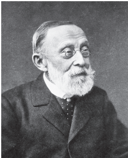
Fig. 1 Rudolf Virchow (1821~1902) ドイツの病理学者。Gliomeの命名者であり脳腫瘍の記述的分類を行った。

神経解剖学の分野では Ramón y Cajal (1852~1934) や Camillo Golgi