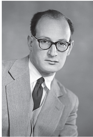
Fig. 8 John J. Kepes (1928~2010)

米国の神経病理学者。脳腫瘍の電子顕微鏡的研究の先駆者であり、かつ第一人者である。