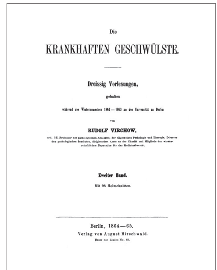
Fig. 2 Virchowの著書“Die Krankhaften Geschwülste”第18章に脳腫瘍に関する記述がある。