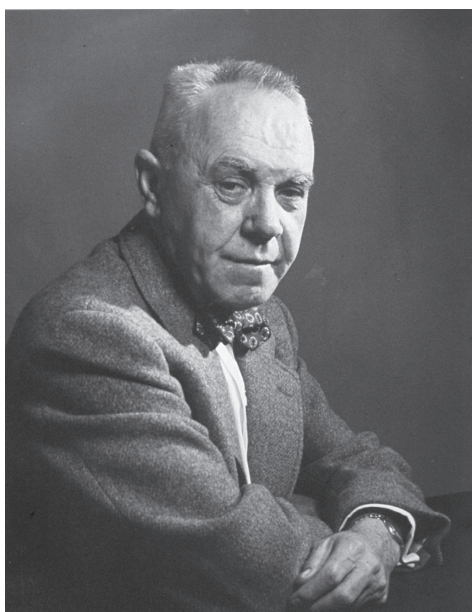
Fig. 6 James W. Kernohan (1896~1981)

アイルランド系米国人で Mayo Clinic の病理医。脳腫瘍の grading system を創出。“Kernohan's notch” としても名を残す。